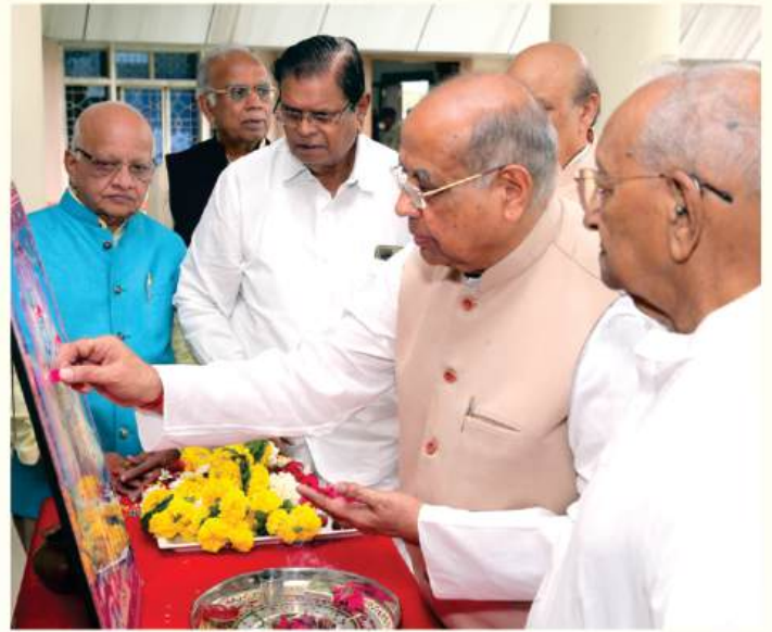
शांति अभिषेक आरती